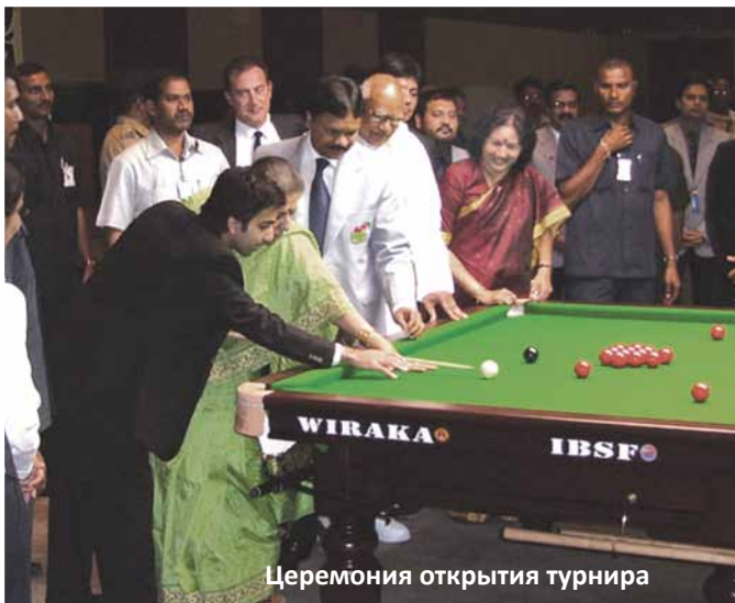
Церемония открытия турнира

обыграл Филиппа Уильямса из Уэльса. В трех этапах плей-офф представители Туманного Альбиона боролись за выход в финал между собой. Сильнейшим стал Альфе Бюрден, обыгравший соответственно валлийца Гевина Пентола со счетом 5:2, шотландца Энтони Макгила — 6:1, Филиппа Уильямса из Уэльса — 7:3 и вышел в финал. В финале Альфе Бюрден со счетом 10:8 обыграл бразильца Фиджерейдо со славянским именем Игорь. В итоге англичанин Альфе Бюрден стал чемпионом мира по снукеру среди мужчин. Высший брейк мужского турнира принадлежит представителю Китая Ю Делю.