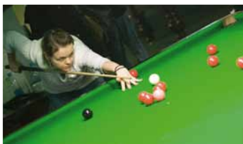
текст: Валерий Куприн

представитель Ирака, который и выиграл первый фрейм. Второй фрейм остался за Дмитрием и судьба финала определялась в решающем третьем фрейме, который безоговорочно выиграл Мохаммад Аидил, показавший очень хороший уровень игры и снукерного мышления.