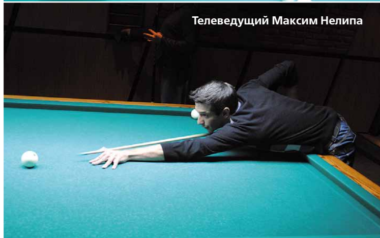
Телеведущий Максим Нелипа