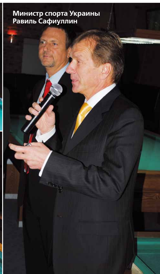
Министр спорта Украины Равиль Сафиуллин