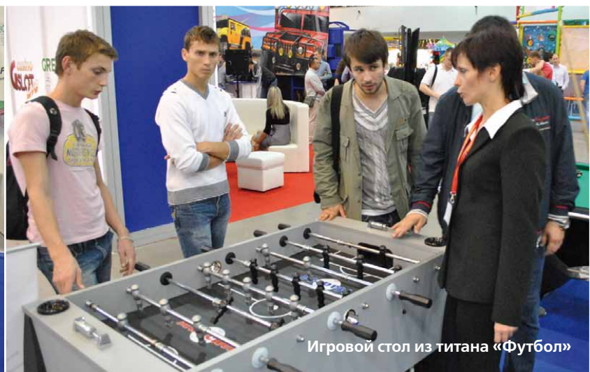
Игровой стол из титана «Футбол»